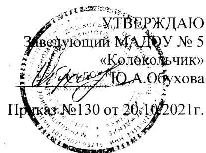
График работы психолого-педагогической комиссии

238750 РФ, Калининградская область, город Советск, улица Карла Либкнехта, дом 8.